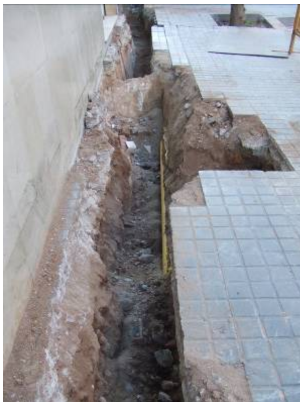
Fotografia núm. 7: vista de la rasa 100