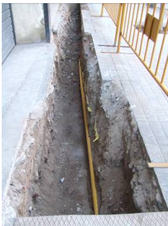
Fotografia núm. 6: vista de la rasa 100