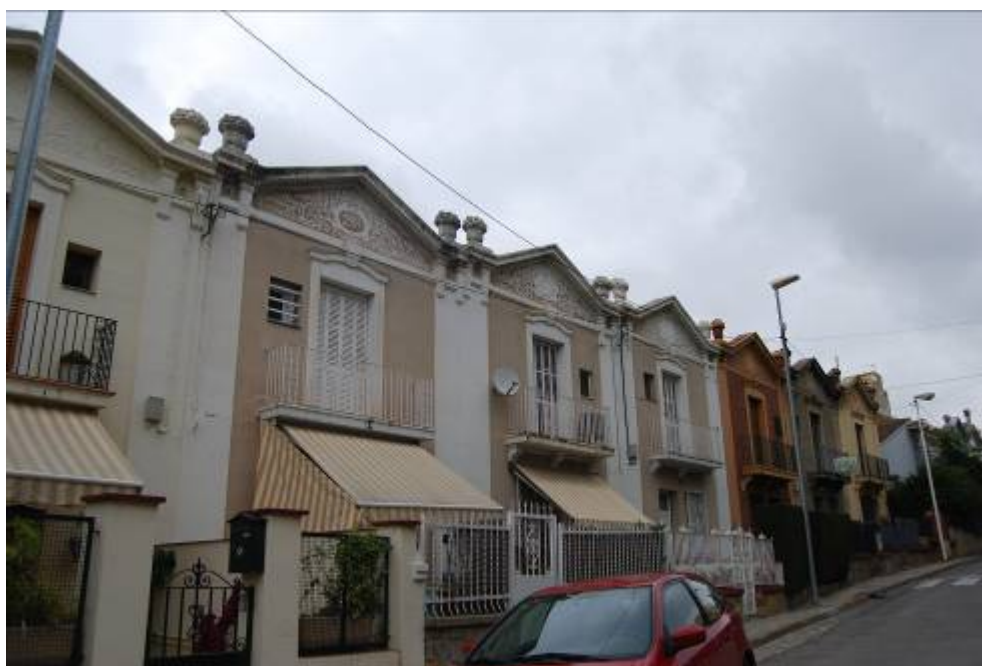
Fotografia núm. 1: cases baixes situades al carrer de la Font Florida