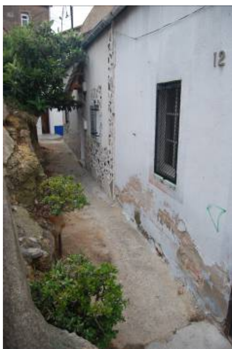
Fotografia núm. 4: pervivència de les cases barates