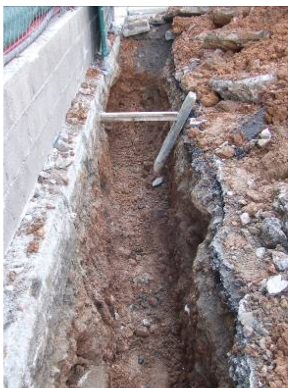
Fotografia núm. 10: vista de la rasa 100