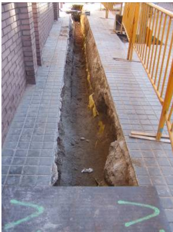
Fotografia núm. 5: vista de la rasa 100