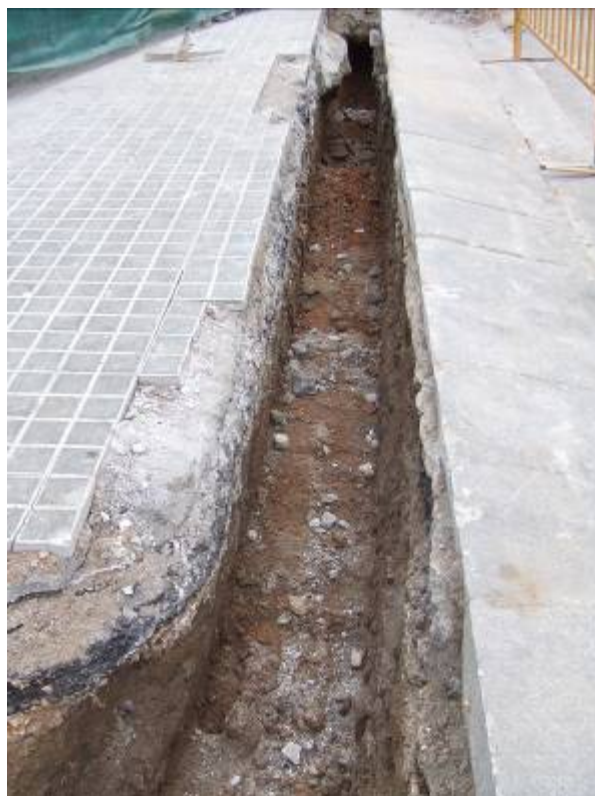
Fotografia núm. 9: vista de la rasa 100