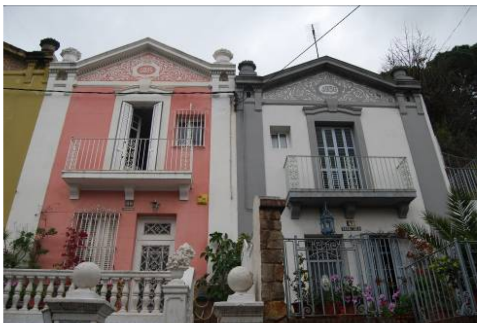
Fotografia núm. 2: façanes al carrer de la Font Florida