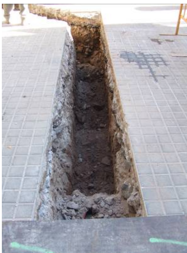
Fotografia núm. 8: vista de la rasa 100