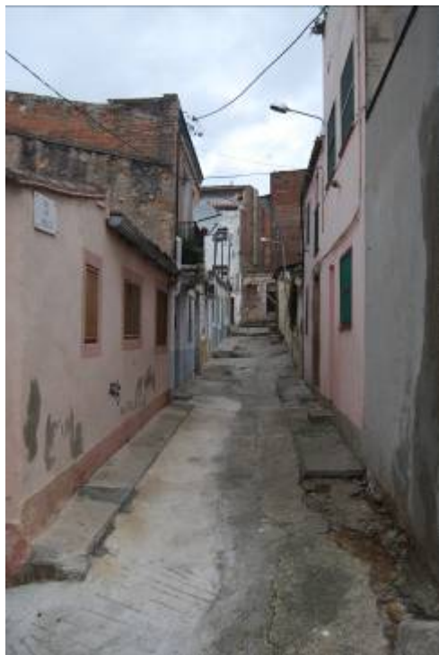
Fotografia núm. 3: sector del barri on perviuen les cases barates